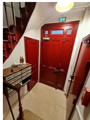
Parties communes