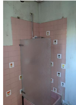
Avant les travaux