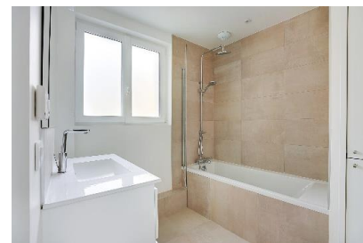
Après les travaux